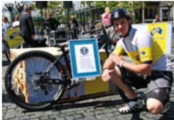
Guinness World Record 20