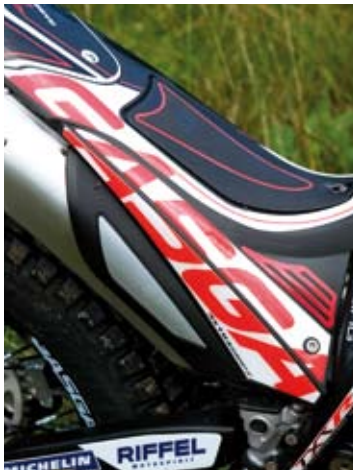
GasGas Raga Replica 2012 60