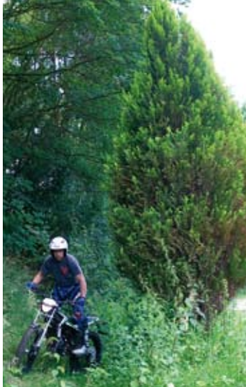
Fahrbericht Ossa Explorer 4